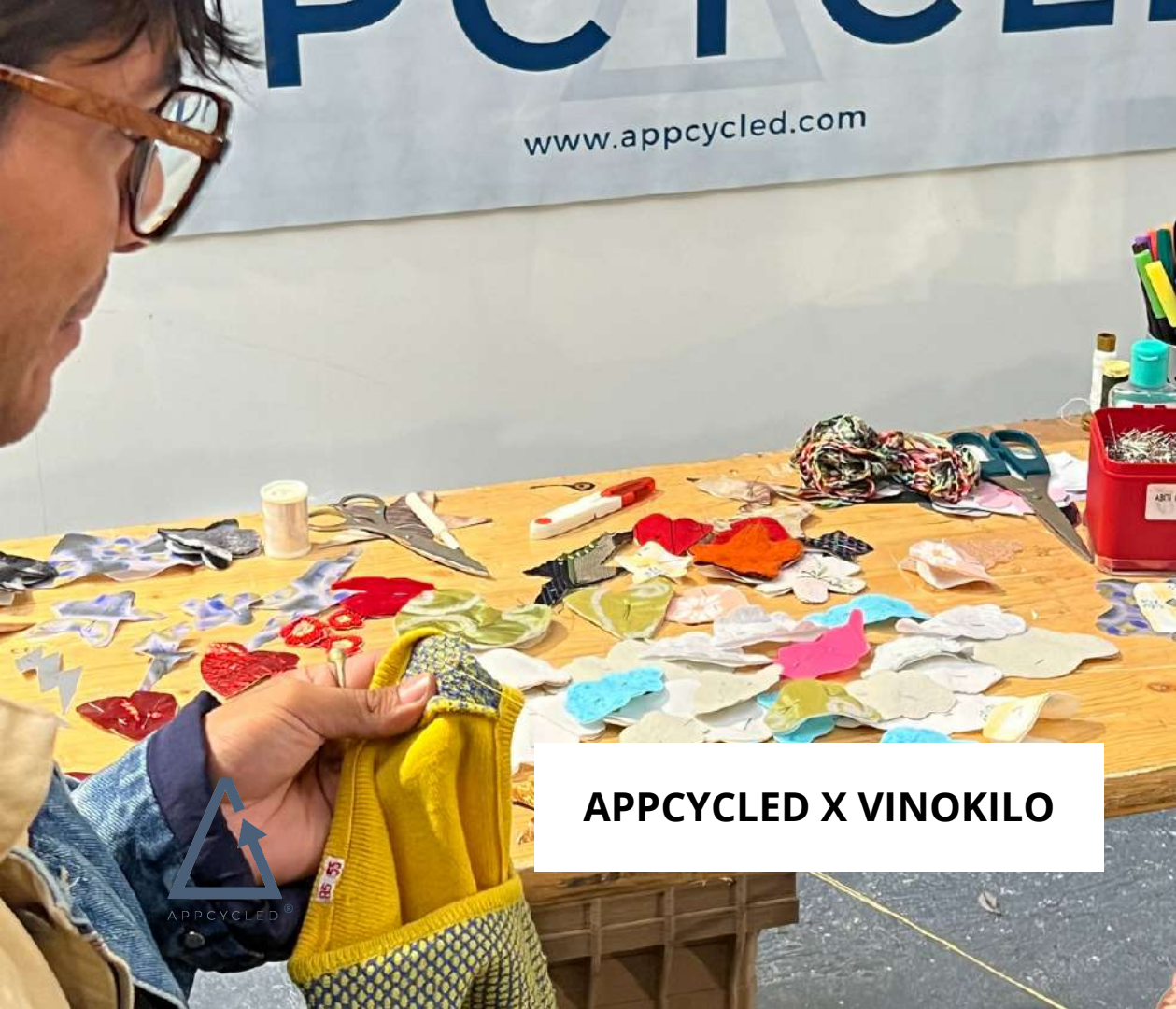
APPCYCLED X VINOKILO